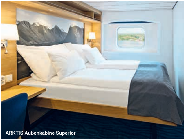
ARKTIS Außenkabine Superior

KABINEN: 221 UND 2 SUITEN BRZ: 11.204 BAUJAHR: 1993 LÄNGE: 121,8 METER MODERNISIERUNG: 2016 UND 2022 BREITE: 19,2 METER WERFT: VOLKSWERFT, DEUTSCHLAND GESCHWINDIGKEIT: 15 KNOTEN