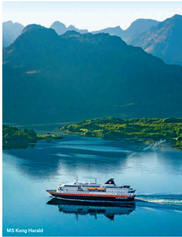
MS Kong Harald