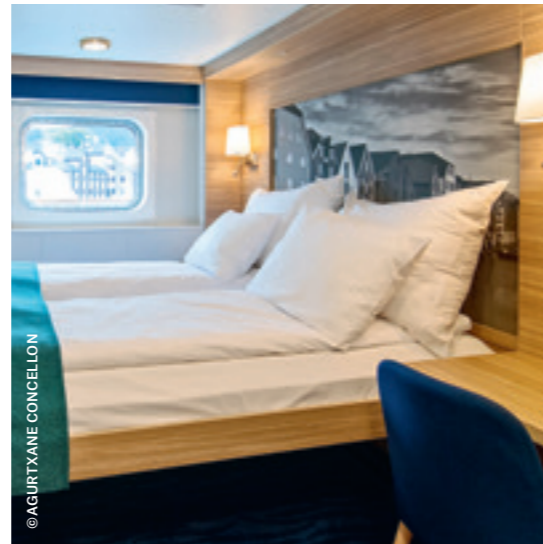
ARKTIS Außenkabine Superior