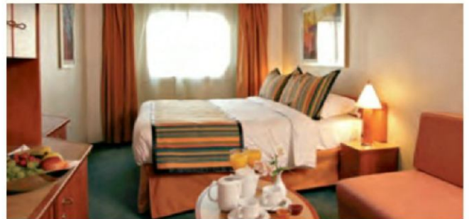
Außenkabine mit Meerblick