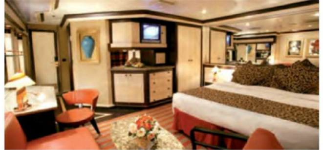
Samsara Suite mit Balkon und Meerblick