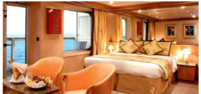
Grand Suite mit Balkon und Meerblick