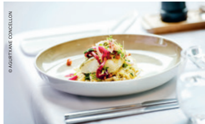
Feinste Speisen à la carte serviert