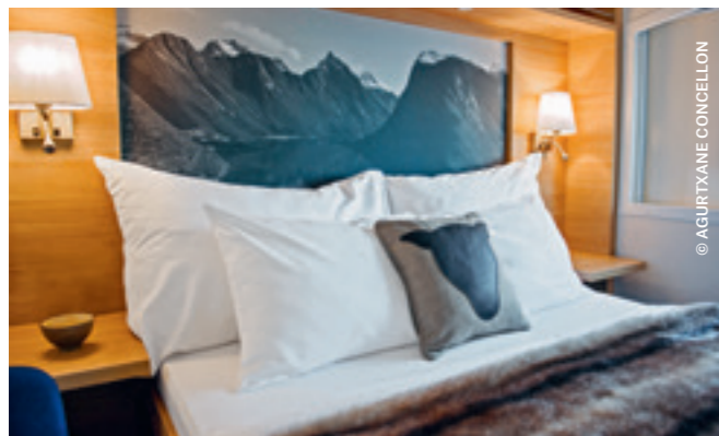
EXPEDITION Suite (Mini-Suite)