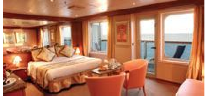
Grand Suite mit Balkon und Meerblick