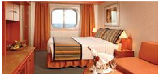
Außenkabine mit Meerblick