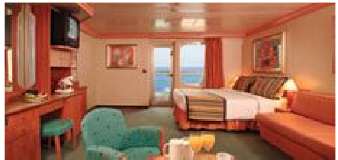
Suite mit Balkon und Meerblick